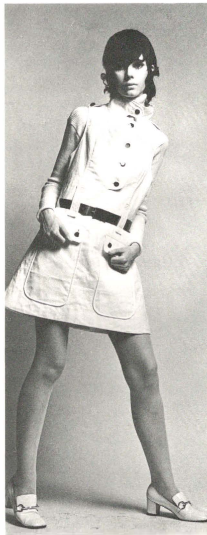
Det er ikke maxi altsammen – endnu. Denne koftelignende spencerkjole af Louis Feraud standser et smukt stykke over knæet. Bemærk de mørke strøpper, her i glat strikning, men de kommer også i riflet udgave. Lyder det ikke skrækkeligt?

Særprægede variationer over det ellers så bekvemme bukse- dragt-tema. Pigen med håret sat op som en riskost har fodlang frakke over en ud-i-et dragt med vide bukseben. Tykke silkesnore og meget brede kapsomme er pynt. Til højre et lidt maskulint værtindedress i silkejersey, der lives lidt op med bluse, der slutter i et draperet skærf om livet. Begge modeller fra Jacques Esterel.